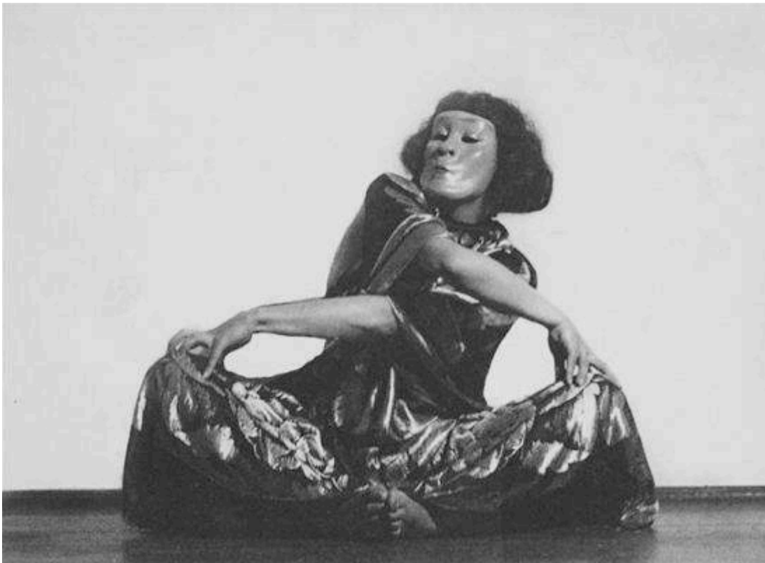
Mary Wigman. Hexentanz (danse de la sorcière) 1926